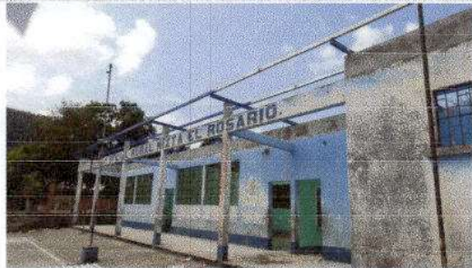
FOTO 1: SUSTITUCION DE LAMINA POR LAMINA TROQUELADA ALUZINC CALIBRE 26