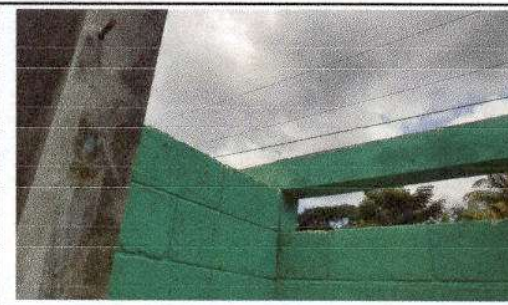
FOTO 4: SUSTITUCION DE LAMINA POR LAMINA TROQUELADA ALUZINC CALIBRE 26 (EN BAÑOS)